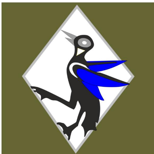
Godło 132 Eskadry Myśliwskiej