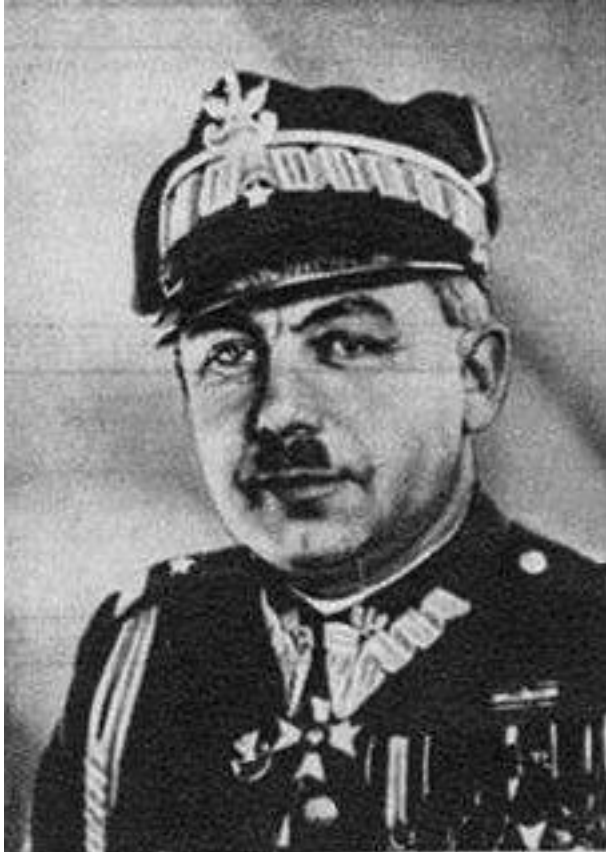
Gen. Edmund Knoll-Kownacki

31 kompania czołgów rozpoznawczych, kompania saperów „Stolin” . Zadaniem wyznaczonym dla GO” Koło” była obrona przedmościa Koło początkowo na „pozycji wysuniętej, następnie głównej, oraz odcinka Uniejów i odcinka pomiędzy rzeką Wartą a jeziorem Pątnowskim. 7 Na miejsce postoju dowództwa GO” Koło” wybrano osiek Wielki z równoczesnym wysuniętym miejscem postoju w Kościelcu. Równocześnie w dniu 5 września utworzono w rejonie Koła lotniska polowe dla 131 i 132 eskadry myśliwskiej początkowo w Babiaku a następnie w Osieku Małym.